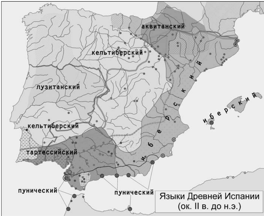
Карта 2. Языки Древней Испании

На западе Пиренейского полуострова был распространен лузитанский язык, известный из 5 надписей (I в. н.э.) и некоторых имен собственных. Общеизвестно вхождение его в индоевропейскую семью, однако связи с известными ветвями остаются неизвестными [4]. К югу от него в начале I тыс. до н.э. был распространен тартесийский язык, от которого сохранилось 95 надписей, выполненных собственным, не до конца дешифрованным, письмом. Хотя ранее этот язык считался до-индоевропейским, в последних исследованиях высказывается немало аргументов за то, что он был индоевропейским, возможно близким кельтским языкам (карта 2) [5].